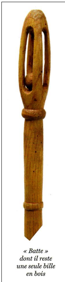
« Batte » dont il reste une seule bille en bois