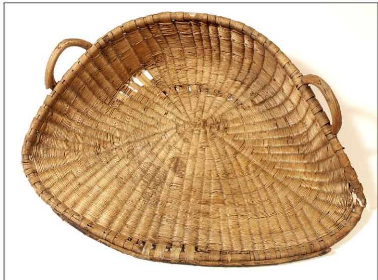
Van en osier, environ 80x110 cm, hauteur 25. Musée de Bretagne, photo Internet.

« Il s'agit d'une huile sur toile au format paysage et de moyenne dimension représentant trois personnages dans un décor rural. Au centre, de dos, on voit une jeune femme portant une robe rouge, agenouillée, en train de cribler des grains de blé au moyen d'un van ; les grains s'accumulent sur un drap beige qui recouvre pratiquement le sol entier ; à gauche, une autre jeune fille, assise en tailleur, portant une coiffe blanche, l'air un peu endormi, trie à la main des grains de blé disposés dans un large plat. Enfin, à droite, assis, un jeune garçon examine l'intérieur du tarare. Autour de ces personnages, se trouvent trois gros sacs, une petite chaise sur laquelle dort un chat roux, des ustensiles (jarre en terre avec sa cuillère, chaudron en cuivre, panier en osier, assiette, bol en bois...). Tout à droite, on distingue une porte fermée sur laquelle est disposée une image dont le motif reste indistinct. La lumière du jour provient d'une fenêtre que l'on ne voit pas mais dont on voit l'ombre sur le mur »