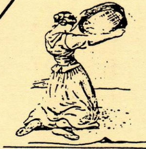
CRIBLEUSE DE BLÉ D'après Courbet.