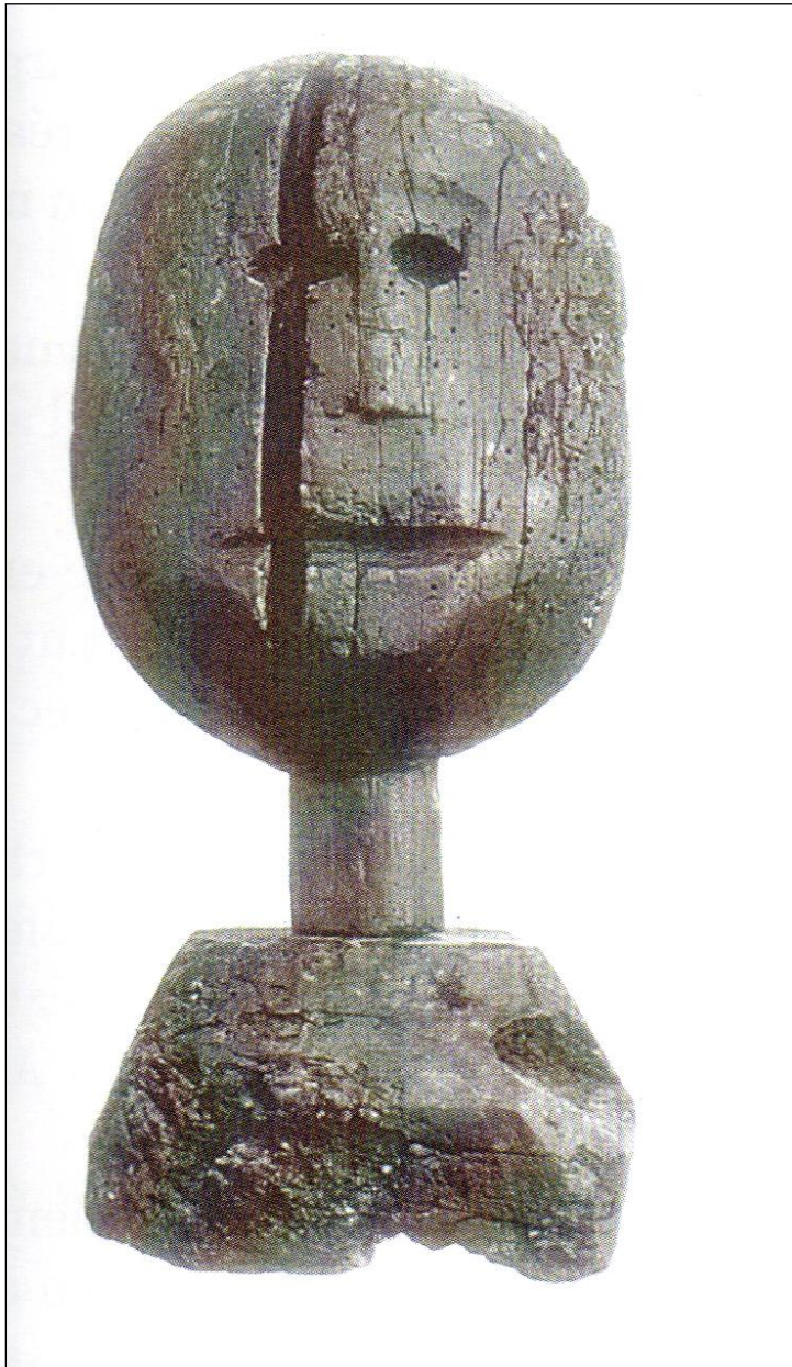
Marotte. Auvergne.