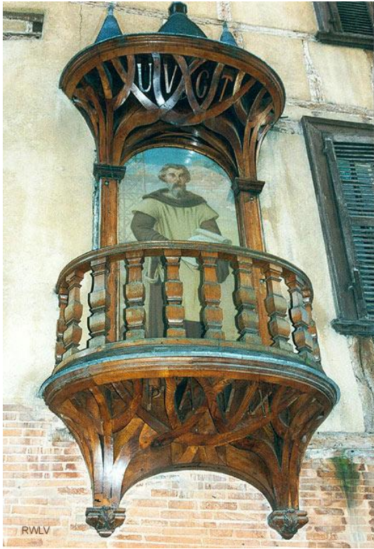
Guitarde à Toulouse, 3, rue de la Tripière. Au sommet UVGT en grandes lettres en bois.

UVGT est connu : Union, Vertu, Génie ou Géométrie, Travail ou Talent selon les sources. Les trois statues représentent les Pères fondateurs des Compagnonnages : Soubise, Salomon (au milieu) et Jacques.